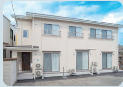
自立援助ホーム 夢住の家