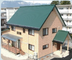
地域小規模児童養護施設 「ぼぶらの木」