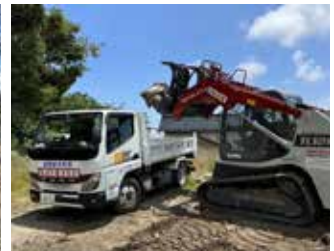
竹内製作所㈱の重機を活かした支援活動をコーディネート R6.5月～