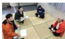
地域の代表者と連合、生協、地域社協の長野チームで打合せ