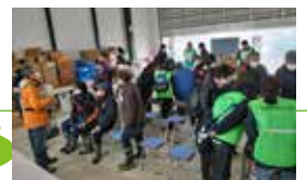
地元ボラ連、消防団、防災士、民生委員が集結してプレオープン

【フェーズ0】 ●被災状況の情報収集 (行政、社会福祉法人、技術系 NPO との連携) R6.1月 ●民生委員地区緊急会議への参加 ●地元主体のボランティア受入・活動開始 (26日～)