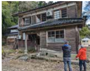
農家民宿群「春蘭の里」（能登町）の再開に向け、建築士が同行して修繕について助言 R6.2月