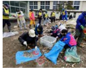
「チームながでん」 延べ約180人が被災地入り。輪島市や珠洲市、能登町で被災住宅の片付けや泥の搬出に取り組んだ様子について、写真を交えて紹介