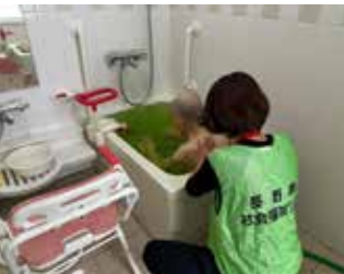
奥能登入浴支援プロジェクト（県介護福祉士会など、輪島市ほか） R6.1月下旬～