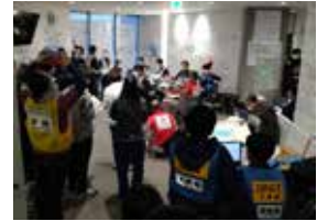
能登町保健医療福祉連携本部会議