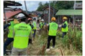
上田市社協ボラ・バン R6.7月 輪島市