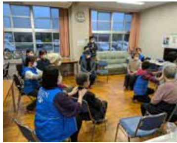
清泉女学院大学 R6.3月 輪島市