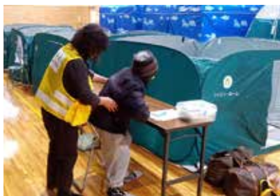
小木デイサービスセンター職員と長野県DWA T チーム員が見守りや支援を担当