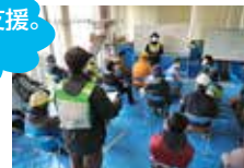
ボランティアへのオリエンテーション (能都サテライト)

【フェーズ2】 ●ボランティア受入本格化 3月～5月 ●長野県内からの支援 (ボランティア・バン) のコーディネート ●ボラ・バン宿泊拠点の「春蘭の里」にミニサテライトを置き、周辺地域のコミュニティマッチングを展開