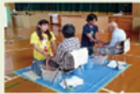
高齢者等への対応