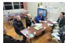
地域の区長に説明し、ニーズのとりまとめと活動日を相談