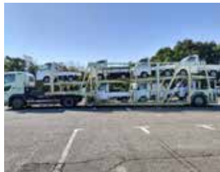
軽トラプロジェクト（復興支援本部など、輪島市、能登町へ） R6.1月～