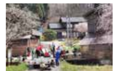
連合長野とボラ・バン (長野県社協の長野チーム) が連携して活動

【フェーズ3】 ●DSAT スポット派遣型に移行 6月～8月 ●サテライト縮小に向けた運営体制の移行支援 ●地域支え合いセンターの始動を支援 ●能登町社協の法人運営 (経営改善) の助言