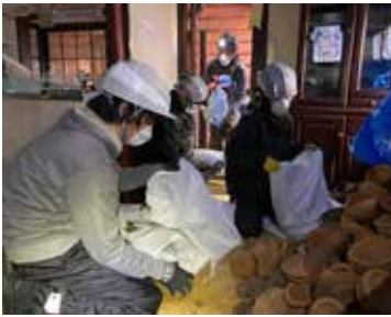
チームうるし R6.3月 輪島市