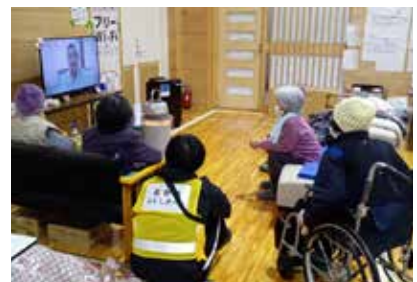
要支援の高齢者も、ここなら落ち着いて過ごしていた