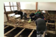
被災家屋の片付け