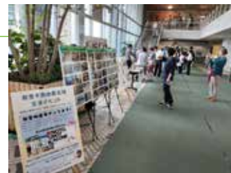
災害NGO結の協力で県庁1Fロビーにて「能登物産展」を同時開催

〈令和6年度出前講座(災害ボランティアセンター学習・設置運営訓練)〉: 19回(市町村社協)