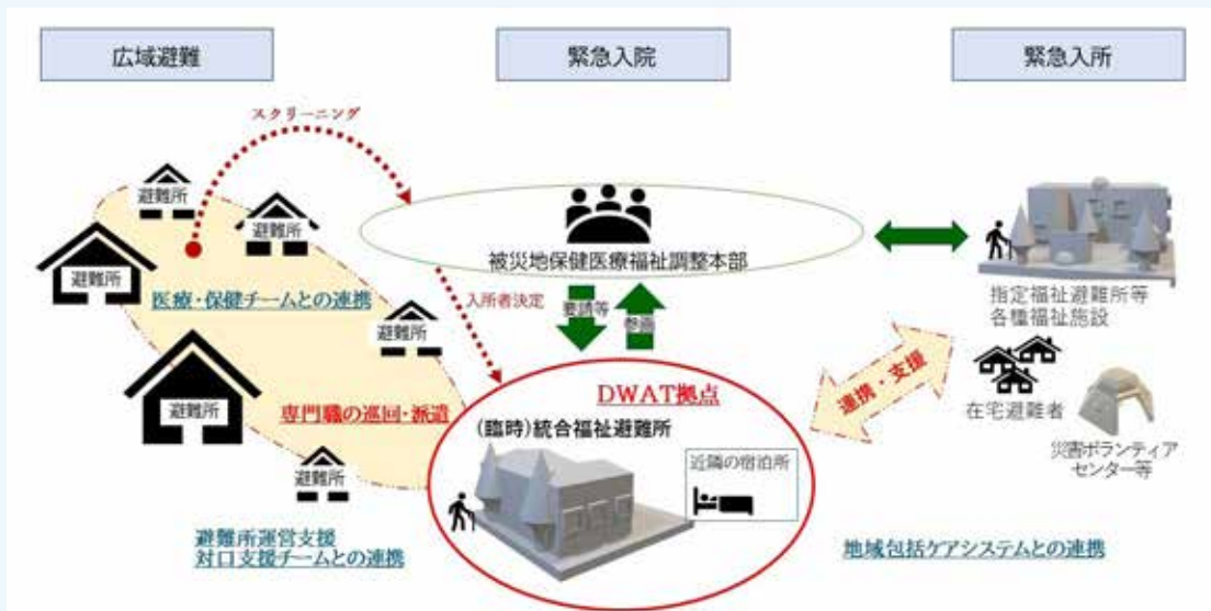
図5 (臨時)統合福祉避難所を含むDWA Tの支援体制案

能登町のように中山間地に避難所が散在し、少数の要支援者が各所に分散している場合は、被災自治体外部からの支援も得ながら、このような「統合福祉避難所」を設置し、これを災害時の地域包括ケアの要として活用することの有効性は今後考慮されるべきであろう。